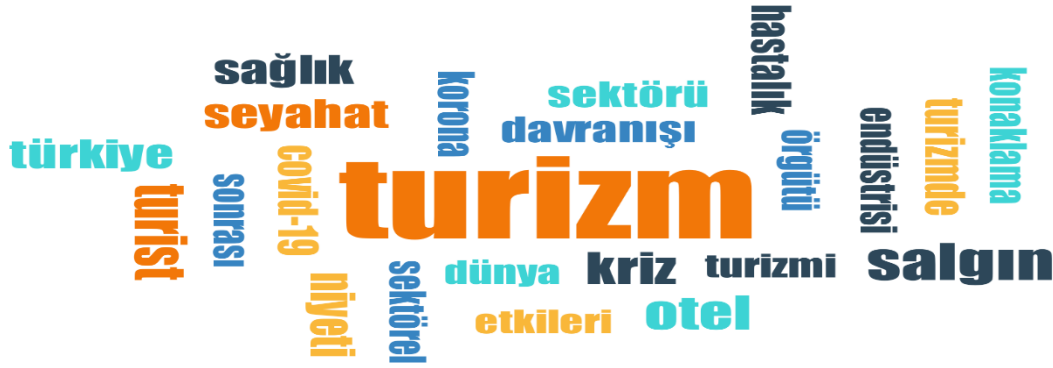
Şekil 2. Anahtar Kelimelerin Kelime Bulutu

Tablo 2’de temalar, alt temalar ve makaleler de kullanılan anahtar kelimeler yer almaktadır. Tabloda anahtar kelimeler listelenirken, Covid-19 anahtar kelimesi ile hastalığı tanımlamakta kullanılan benzer kelimeler dahil edilmemiştir. Ayrıca, her bir alt temaya dahil edilen makalelerde ortak kullanılan kelimelere tabloda sadece bir kez yer verilmiştir. Şekil 2’de anahtar kelimelerin dağılımını gösteren kelime bulutu yer almaktadır. Kelime bulutu ile araştırma kapsamında incelenen makalelerin anahtar sözcükleri sıklık derecelerine göre görselleştirilmiştir.