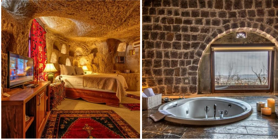
Resim 2. Mağara ve Taş Evlerden Dönüştürülmüş Palimpsest Otel Odası Örneği (Museum Hotel/Kapadokya)

olduğunu savunmaktadır. Cojocarü, ortaya çıkan bu eğilimin, kentin palimpsest doğasının bir yıkım ve yeniden inşa döngüsünü vurguladığını savunur. Öte yandan Lefebvre (1991), turiste sunulan destinasyon imajı ile ilgili olarak Venedik örneğinden hareketle önemli bir çıkarımda bulunur. Lefebvre, Venedik'in her ne kadar 16. yüzyıldan beri turistik olmanın ötesinde derin anlamlar içerip birçok özelliği bünyesinde barındırır da turiste sunulan manzaranın aslında turiste iletilen bir koddan ibaret olduğunu savunur. Örneğin Venedik'te denizin yüceltilmesi ve şehir sakinlerinin denize bir anlamda hâkim olması yani "mekânın temsili" ile incelikle işlenmiş Venedik sokak dokusu, oradaki haz ve fütursuzca harcanan servet, yani "temsil mekânı" aslında birbirini tamamlamaktadır. Lefebvre bu tamamlamayı, su ve taşın yani kanalların ve sokakların karşılıklı olarak birbirini güçlendirmesi olarak tasvir eder.