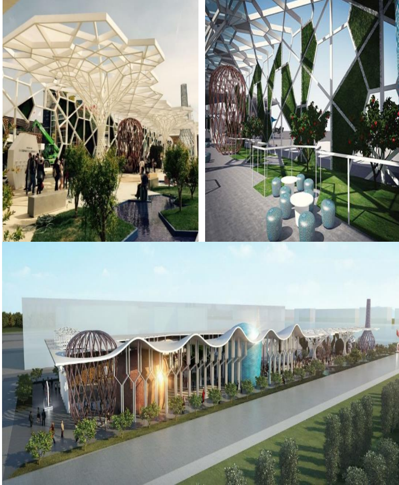
Şekil 6. Expo 2015 Milano, Türkiye Pavyonu (Url-45)- (Url-46)- (Url-47)

bir şekilde, yarı açık bir park alanı şeklinde tasarlanmıştır. Tasarımın yansıttığı kültürel izlere bakıldığında; Osmanlı Mimarisi'nden kubbe, revak ve altıgen formlar, taşıyıcı sistemde "Çeşm-i Bülbül" geleneksel cam sanatı ögesi kullanılmıştır (Onbay, 2020). Türkiye pavyonu, Expo 2015 Milano'nun toplam ziyaretçi sayısının dörtte birine denk gelen 5 milyon kişi sayısı ile oldukça ilgi gören bir tematik yapı olmuştur. Tasarım ekibinden, Dream Design Factory kurucu ortaklarından Esra Ekmekçi "Mimari konsept ve tasarımını üstlendiğimiz Türkiye pavyonunda hafta sonlarında günlük ortalama 70 bin ziyaretçi sayısına ulaşıldığını söylemiştir (Url-44).