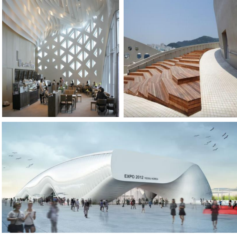
Şekil 3. Expo 2012 Yeosu, One Ocean (Url-24)- (Url-25)- (Url-26)