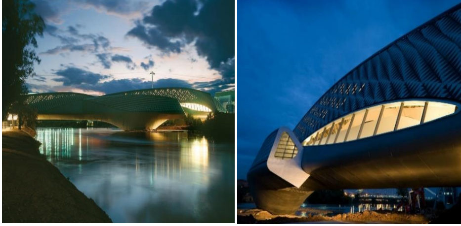
Şekil 1. Expo 2008 Zaragoza, Bridge Pavilion (Url-9) - (Url-10)