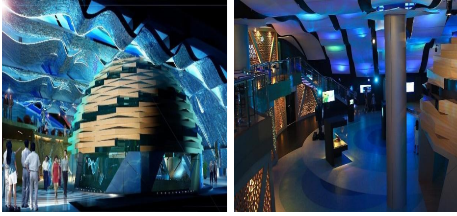
Şekil 4. Expo 2012 Yeosu, Türkiye Pavyonu (Url-30)- (Url-31)