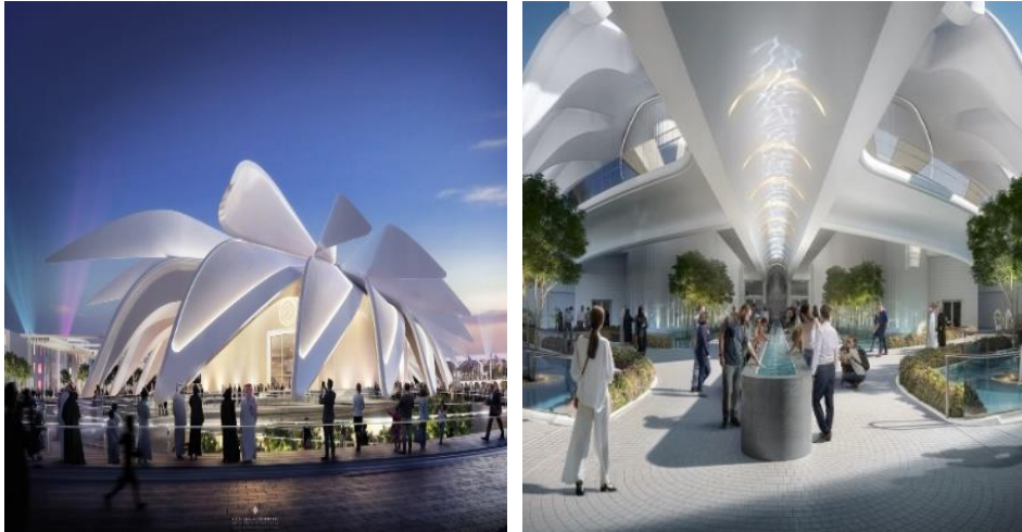
Resim 7. Expo 2020 Dubai, "The BAE Pavilion" (Url-55)- (Url-56)

Expo Dubai 2020 tematik yapılarından biri olan "The BAE Pavilion", Dünya'nın önde gelen mimarlık ofislerinin sunumlarının yer aldığı, 7 ay süren bir Uluslararası Mimari Tasarım Yarışması ile seçilmiştir. Santiago Calatrava'nın tasarımı yarışmada 1.'lik derecesini almıştır (Url-53). BAE pavyonu'nun tanıtım kurgusu, Birleşik Arap Emirlikleri'nin kültürel zenginliğinin ifadesi ve ileriye dönük kentsel planlamaların potansiyellerini yansıtmak üzere hazırlanmıştır. Yapının tematik yansımalarına bakıldığında ise, farklı kültürlerle uyum içinde olabilmek ve huzurlu bir birliktelik hedefi gözlenebilmektedir (Url-54).