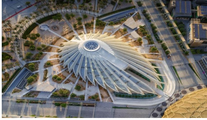
Resim 8. Expo 2020 Dubai, "The BAE Pavilion" Kuş Bakışı Görünüm (Url-56)