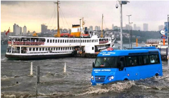
Şekil 1. Üsküdar Meydanı-2014 (Url 2)

Çölleşme: Rüzgâr ve kum erozyonu, biyolojik çeşitliliğin ve toprak verimliliğinin kaybı gibi çeşitli etkileri bulunmaktadır.