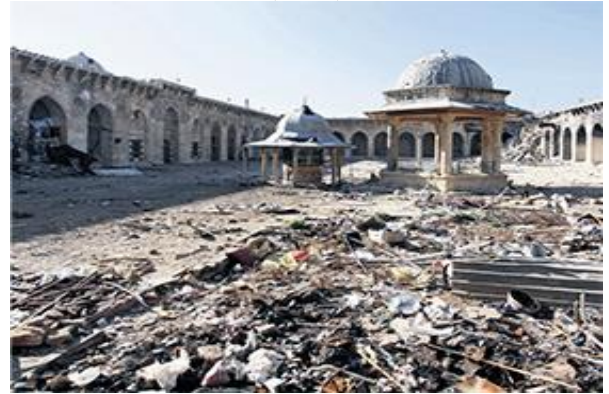
Şekil 6. Suriye'de Yaşanan Savaşın Etkileri (Url 7)