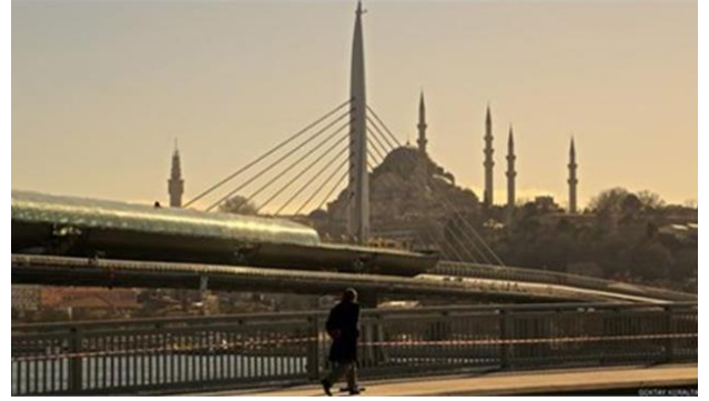
Şekil 4. Tarihi Yarımada Silueti Bozan Ulaşım Aksı (Url 5)