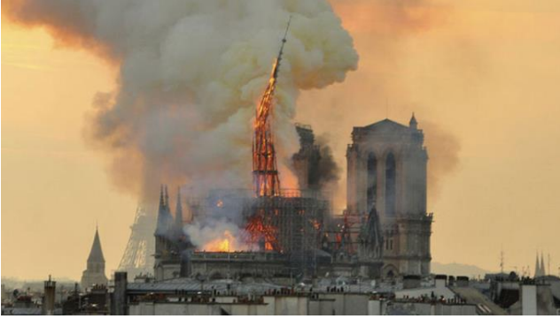
Şekil 3. Norte Dame Katedrali Yangını-2019 (Url 4)

Uluslararası Terörizm ve Savaşlar: İnsanları olduğu kadar kültürel mirası da tehdit etmektedir. Bu alanlar ziyaretçi çeken yerler olduğu için terörizmin hedefi olabilmektedir. Terörizmin değişen doğası tarihi alanlara yapılan ideolojik kökenli kasti saldırıları da beraberinde getirmiştir (Şekil 6).