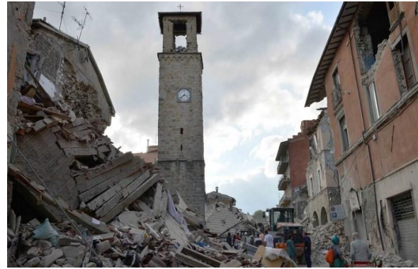
Şekil 2. 6.2 Şiddetinde İtalya Depremi-2016 (Url 3)