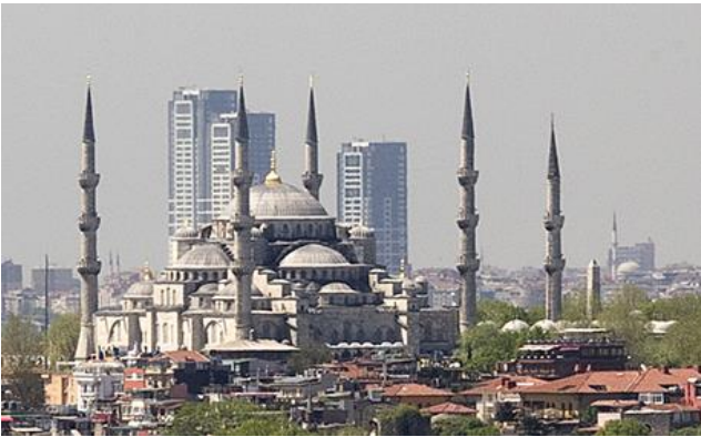
Şekil 5. Sultanahmet Camii'nin Silueti Bozan Kuleler (Url 6)