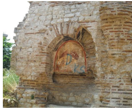
Resim 11: İlyas Peygamber, Balatlar Kilisesi