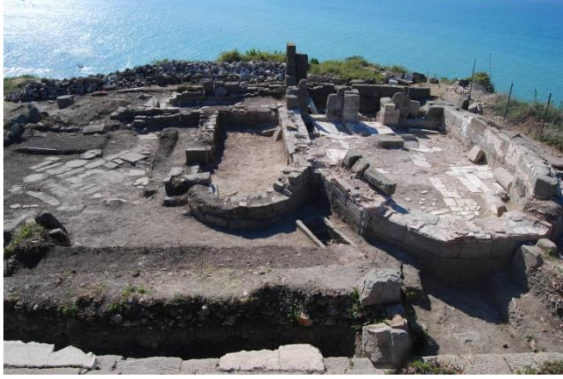
Resim 6: Akropolis Kazıları, Kilise

çok sayıda keramik heykel parçaları, sikkeler, yazıtlar ile kısmen taş döşeli yollar ortaya çıkarılmıştır (Öztürk, 2013; Batı Karadeniz Kalkınma Ajansı, 2018).