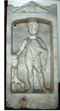
Resim 5: Çocuk Herakleitos'un Mezar Taşı, Karadeniz Ereğli Müzesi

Kaynak: Öztürk, B. (2013). Herakleia Pontika (Zonguldak – Karadeniz Ereğli) Antik Kenti Epigrafik Çalışmaları ve Tarihsel Sonuçları, I. Uluslararası Karadeniz Kültür Kongresi Bildiri Kitabı, s:520, 523, 527.