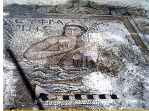
Resim 15: Euphrates Mozaïği, Hadrianoupolis