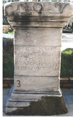
Resim 4: Valentianus, Theodosius ve Arcadius'un Onurlandırılması, Karadeniz Ereğli Müzesi