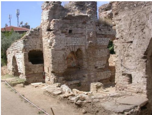
Resim 10: Ayazma, Balatlar Kilisesi

Geç Roma döneminden günümüze kalan Balatlar Kilisesi ya da 'Mitridates Sarayı' olarak bilinen yapı topluluğu surlardan sonra gerçek işlevi belirlenen en büyük yapıdır. Çevresi yoğun yapılaşmaya maruz kalmış yapı kalıntısından günümüze iki büyük haç planlı yapı ile dikdörtgen planlı büyük bir salon ulaşmıştır. Bazı kaynaklarda yapının Roma döneminde hamam, gymnasium ve palaestra (spor yapısı) olarak inşa edildiği Doğu Roma İmparatorluğu döneminde ise (6-7. yüzyıl) manastır ve kilisenin kurulduğu, 11. ve 13. yüzyıllarda ise tahıl deposu olarak kullanıldığı ve Sinop'un Türklerin eline geçmesinden sonra manastıra dönüştürüldüğü ve aynı zamanda Ortodoks Hıristiyan halk için mezarlık alanı olarak da kullanıldığı belirtilmektedir (Köroğlu, 2013). Osmanlı imparatorluğunun son dönemine tarihlenen mezarlıkta bulunan kemikler üzerine yapılan çalışmaların Balatlar'daki Ortodoks halkın ölümü nasıl algıladığı, ölü gömme geleneklerinin neler olduğu ve Hristiyanlık tarihi boyunca nasıl değişim yaşadığını göstermesi açısından önemli bir kaynak olduğu ifade edilmektedir. Balatlar Kilisesi'nde sürdürülen arkeolojik kazılarda mezarlara gömü hediyesi olarak konulmuş ithal ve yerel üretim seramik çeşitleriyle karşılaşmıştır. 2010 yılında başlanan kazı çalışmaları halen devam etmektedir (Köroğlu, 2013).