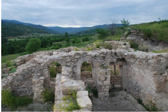
Resim 14: Roma Hamamı, Hadrianoupolis

Hadrianoupolis Antik Kenti’nde dikkati çeken unsurlardan birisi de tepelik kısımlarda bulunan bağcılık faaliyetleri için yapılmış teraslardır. Hadrianoupolis’te ortaya çıkarılan Erken Bizans kiliselerinin tabanında bulunan bağcılık faaliyetlerinin resmedildiği bu tasvirler kentte bağcılığın ne kadar önemli olduğunu göstermektedir. Kilise A ve Kilise B’de yer alan üzüm temaları görülmeğe değerdir. Hadrianoupolis Antik Kenti’nde şarap üretiminde kullanılan sıkma taşları bölgede bağcılığın antik dönemden beri var olduğunu kanıtlamaktadır (Lafli, 2008a: 19).