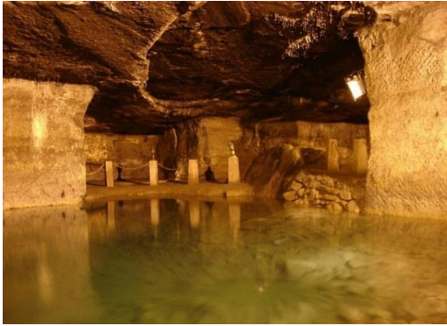
Resim 3: Cehennemağzı Mağarası

Yapılan incelemelerde ortaya çıkan Dor lehçesinin izlerini taşıyan Hellenistik, Roma ve Bizans dönemlerine ait bazı yazıtlar; imparator ve devlet görevlileri için onurlandırmalar, tanrı-tanrıçalara sunulan adaklar ile mezar taşları kentten sosyo-politik, sosyo-ekonomik, sosyo-kültürel yapısı ve dini tarihi açısından önemli bilgiler sunmaktadır. Tanrıça Ma ve Herakles'e adanmış adaklar Roma Dönemi'nde kent ve yakın çevresindeki dinsel inanışları göstermektedir. Keza mezar taşlarının üzerindeki yazıtlar, sahiplerinin isimleri, meslekleri, sosyal konumları ve hatta mezar soygunculuğuna karşı konulan mezar cezaları da kentten siyasi, kültürel ve ekonomik tarihine ilişkin önemli bilgiler sunmaktadır (Öztürk, 2013: 511-512).