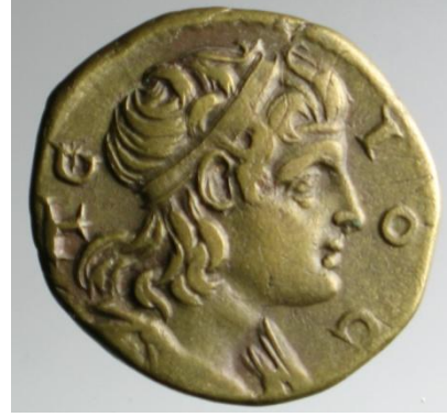
Resim 7: Rahip Tios, Roma Dönemi İstanbul Arkeoloji Müzeleri Koleksiyonu

Kaynak: Öztürk, B. (2013). Tios / Tieion (Zonguldak - Filyos) Antik Kenti Epigrafik Çalışmaları ve Tarihsel Sonuçları, I. Uluslararası Karadeniz Kültür Kongresi Bildiri Kitabı, s; 498-499.