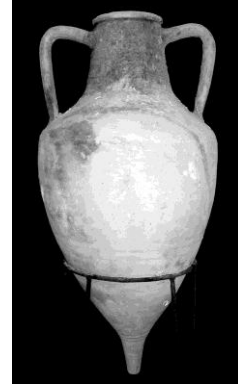
Resim 13: Bosporos Krallığı (MS 2.-3. yüzyıl) dönemine ait Amfora, Sinop Arkeoloji Müzesi

Kaynak: Fotoğraf 10-12 - Köroğlu, G. (2013) Sinop Balatlar Kilisesi 2010 ve 2011 Yılı Kazı Çalışmaları, 1. Uluslararası Karadeniz Kültür Kongresi Bildiri Kitabı, s; 403,404,405,414; Fotoğraf 13 - Kassab Tezgör, D. (2013). The Amphorae in the Museums of the Northern Coast of Turkey Typology and Trade Roads, 1. Uluslararası Karadeniz Kültür Kongresi Bildiri Kitabı, s; 585.