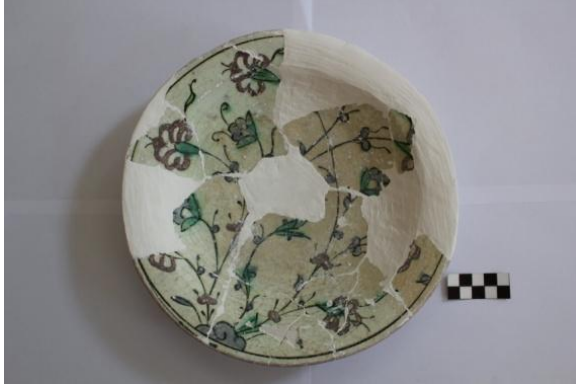
Resim 12: Kütahya işi seramik, Balatlar Kilisesi