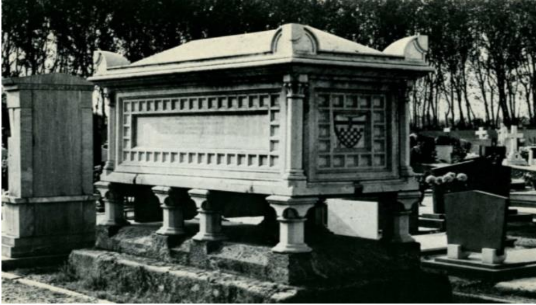
Resim 4. Prenses Belgiojoso'nun Mezarı, İtalya Milano (Yoon, 2014, s. 46, fig. 1.7)

Yazışmalardan anlaşılacağı gibi Prenses Belgiojoso 1871 yılında vefat ettikten sonra kızı Maria, kısa bir süre daha Anadolu'daki çiftlik ve tarlaları için resmi makamlarla yazışmalar gerçekleştirmiştir. Maria'nın yazışmaları neticesinde cevap alamadığı ve annesi Belgiojoso kadar mücadeleci olmadığı düşüncesiyle mülklerinden vazgeçtiği düşünülmektedir.