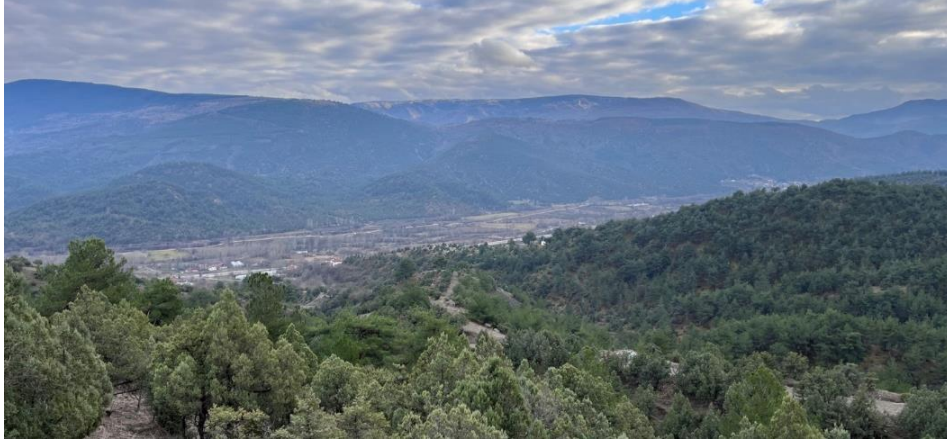
Resim 5. Karabük, Çatma Vadisi’nden (Çakmakçoğlu) Büyük Tarla’ya Bakış (07.01.2023) 28